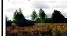
Химическое загрязнение почвы